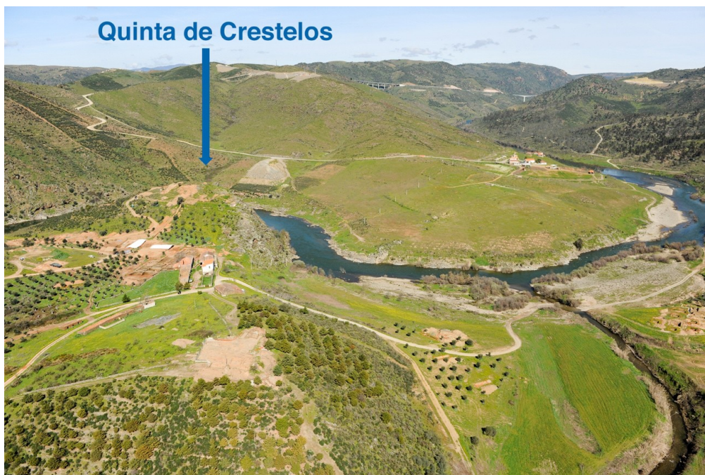
Fig. 2. Localización de la Quinta de Crestelos junto al río Sabor (DORDIO 2015). Fig. 2. Location of Quinta de Crestelos close to Sabor River (DORDIO 2015).