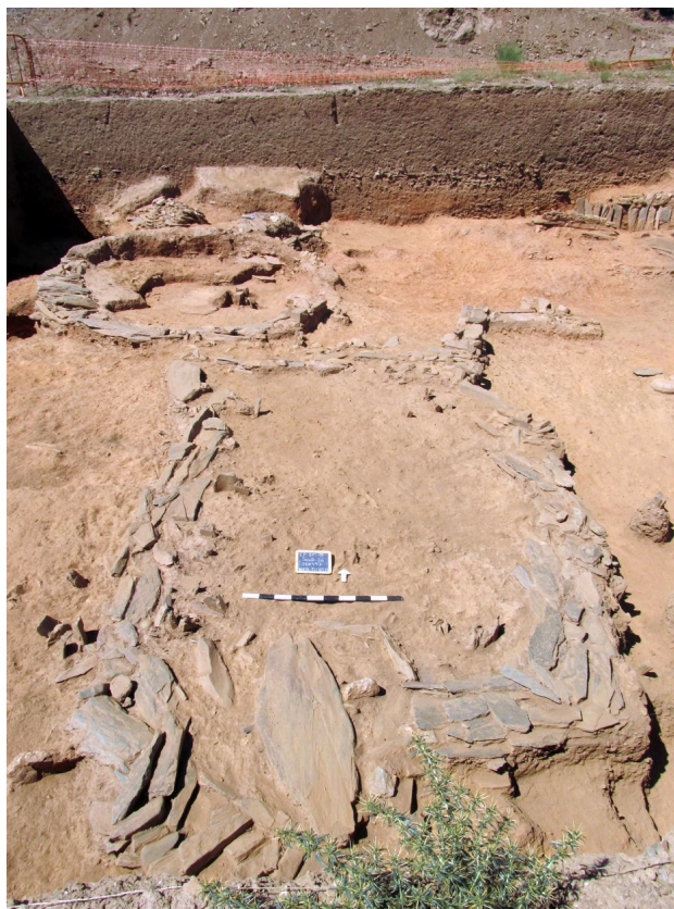
Fig. 7. Sondeo 36: Cabaña circular de piedra y adobe y estructura de almacenaje/secado.

La ocupación protohistórica de la plataforma de Crestelos muestra, en definitiva, fuertes semejanzas con la documentada en el sector inferior del poblado zamorano de La Corona/El Pesadero de Manganeses de la Polvorosa. Especialmente con su Fase IIa, fechada entre mediados del siglo IV e inicios del I a.C. y caracterizada por un modelo de ocupación del espacio basado en el agrupamiento de las estructuras domésticas, funcionales y cultuales —aún de planta circular y naturaleza térrea—, en unidades de ocupación delimitadas por muros de tapial/adobe y zócalo de piedra (MISIEGO et al. 2013: 330-332).