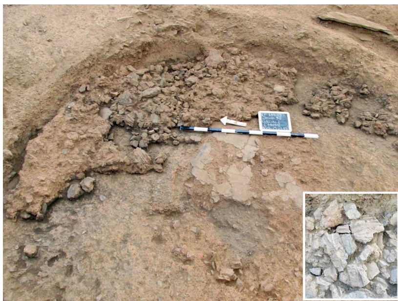
Fig. 4. Sondeo 38. Derrumbe de manteados de barro con improntas vegetales. Fig. 4. Area 38. Collapse of clay walls with vegetal impressions.

tro interno, cuyo esmerado piso de arcilla y sus paredes levantadas con adobes prismáticos de 0.30/0.35 m de lado reflejaban claramente un mayor cuidado constructivo que el mostrado en las fases anteriores (Fig. 5). Sería consumida por un incendio que provocó el derrumbe de sus paredes hacia el interior de la vivienda, en donde aún se hallaban numerosas cerámicas de factura manual y otras a torno de filiación meseteña que orientaban fechas en torno a los siglos III-II a.C.