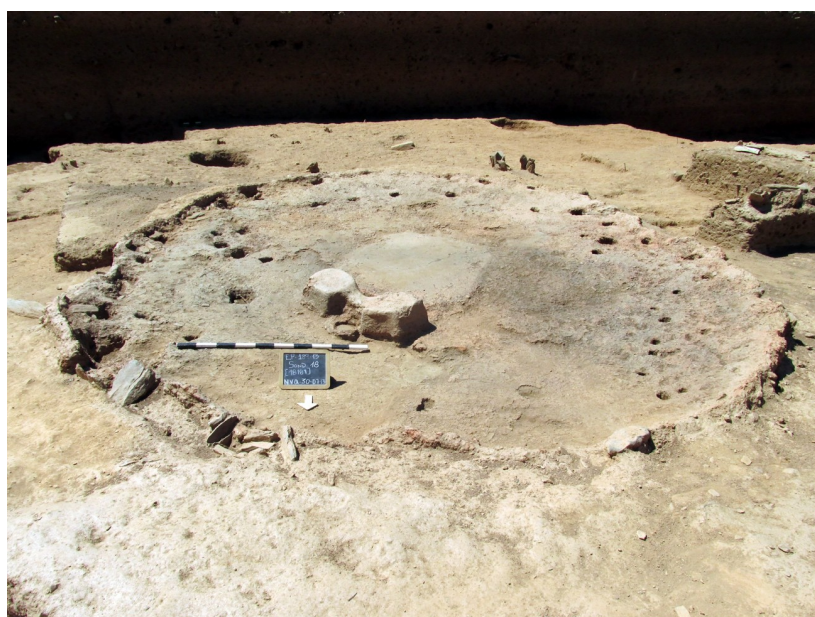
Fig. 5. Sondeo 18: Cabaña circular de adobes con alineamientos de agujeros de poste Fig. 5. Area 18: Round house of adobe with lines of post-holes