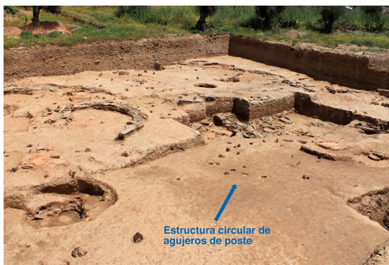
Fig. 3. Sonda 19. Estructura circular de agujeros de poste en el fondo de la secuencia estratigráfica.

En varios puntos de esta área se atestiguó la existencia de superposiciones de cabañas que certificaban la aplicación de un progresivo mayor empeño en su construcción, con empleo de materiales cada vez más sólidos. Esta situación resultaba particularmente evidente en los sondeos 18 y 19, en donde se concentraban las estructuras más antiguas de la secuencia, restringidas a simples alineamientos curvos de agujeros de poste que aún conservaban piedras de calzo en su interior (Fig. 3). Con todo, su interpretación y orientación cronológica resultaba problemática dada la escasez de plantas completas y de pisos asociados.